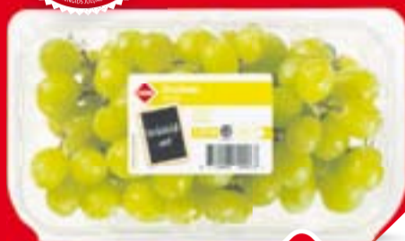
C1000 Pitloze witte druiven bak 500 gram