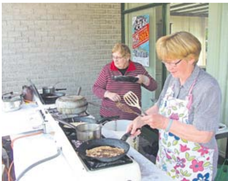
Veel pannenkoeken werden er gebakken in Wilp.

WILP.- Voor de ingang van dorps-huis de Pompe werden afgelopen Hemelvaartsdag volop pannenkoeken gebakken. Na een fietstocht is het heerlijk om van deze lekkernij te genieten en weer op krachten te komen. Ruim 230 mensen namen deel aan deze fietstocht. Er konden diverse afstanden afgelegd worden. Bovendien was er een wandelroute uitgezet. Het was gezellig druk in Wilp deze mooie zonnige dag. Rondom de Pompe was een kleine kunstmarkt, met onder meer schilderkunst te bezichtigen. In de kerk, die was opengesteld, waren