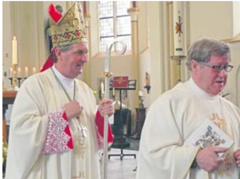
Na de eucharistieviering, die zich als indrukwekkend laat kwalificeren

staat de schrijfster ter beschikking voor het beantwoorden van vragen en om het boek te signeren. Ook de speciale jubileumwijn is verkrijgbaar en alle opbrengsten gaan naar de Martinus Kerk zodat men straks de geschiedenis in kan gaan met een nieuw 'glas in lood raam'.