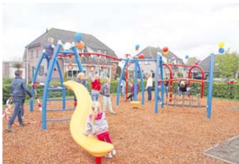
Het nieuwe speeltoestel

Surinameweg 27 7333 PC Apeldoorn Tel : 055 5342522 Fax : 055 5341835 info@autoschadehagen.nl