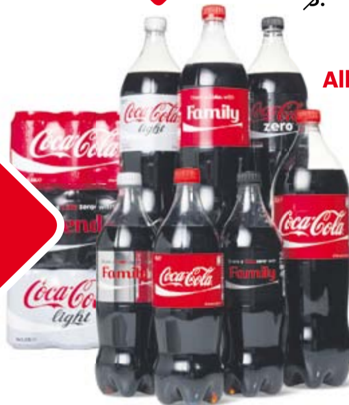
Alle Coca-Cola fles, blik of set