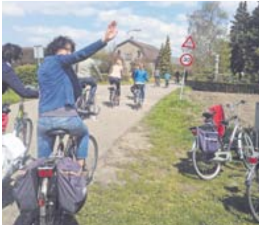
Eerste SCK dauwtrappen waar succes!

KLARENBEEK.- De eerste keer dat Sportclub Klarenbeek (SCK) het dauwtrappen heeft georganiseerd is het een zeer succesvolle dag geworden. De inschrijving begon om acht uur voor de vroege vogels, om elf uur konden de laatste deelnemers zich inschrijven om de prachtige tocht te gaan maken. In totaal werd er door een kleine 200 mensen deelgenomen aan de tocht. Er waren twee tochten uitgezet, 20 en 40 km, waarbij bij de lange afstand een pauzeplek in Twello was opgenomen. De 20 km dauwtrappers gingen de prachtige dorpen Wilp-Achterhoek, Bussloo, Voorst en natuurlijk Klarenbeek aan. De 40 km dauwtrappers zagen naast de hiervoor genoemde dorpen ook Teuge, De Vecht, Twello, Steenkamer, Wilp en Gietelo. Op de pauzeplek in Twello, maar ook zeker na afloop op het sportpark, werd er gezellig een drankje gedronken en genoot men van de fantastische muziek. Het prachtige weer en de enthousiaste fietsers hebben ervoor gezorgd dat het eerste dauwtrappen van SCK fantastisch is verlopen. Alvast tot volgend jaar! Tip: zie ook de foto's op de website van SCK.