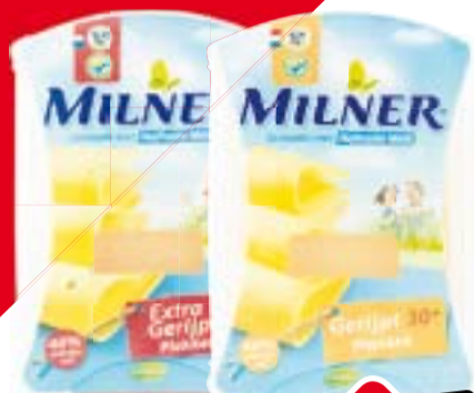
Milner 30+ kaasplakken alle varianten 2 pakjes à 175 gram Alle combinaties mogelijk