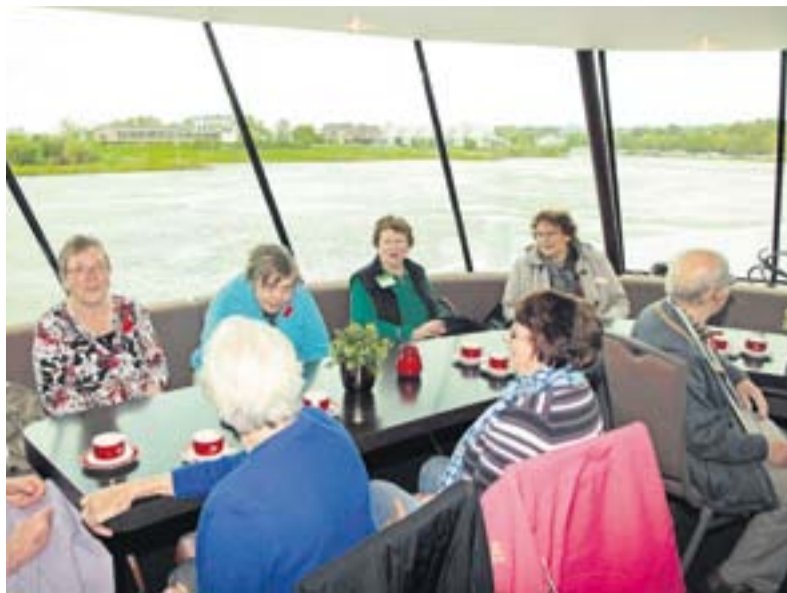
Deelnemers aan de boottocht.