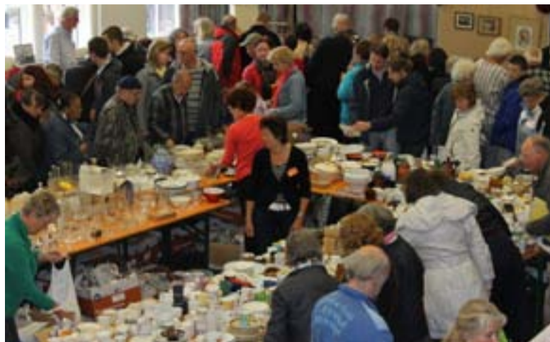
Heel erg druk op de Reskevomarkt

VOORST.- De opbrengst van de rommel en antiekmarkt ten bate van restauratie en onderhoud van de dorpskerk van Voorst was bijna EUR 18.000.00 Iets minder dan in het recordjaar 2011. De veiling van topstukken bracht EUR 2011 op. De kinderen van de Toppies haalden in hun kraam EUR 83.35 op en het Rad van Avontuur, na jaren van afwezigheid weer in ere hersteld, liet een opbrengst zien van EUR 1575.00. De dvd van de eerste rommelmarkt in 1981 bracht EUR 230.00 op. Er zijn nog enkele exemplaren van deze dvd te koop à EUR 9.95. Liefhebbers kunnen mailen naar m.ruijsch@gmail.com om nog een dvd te verkrijgen.