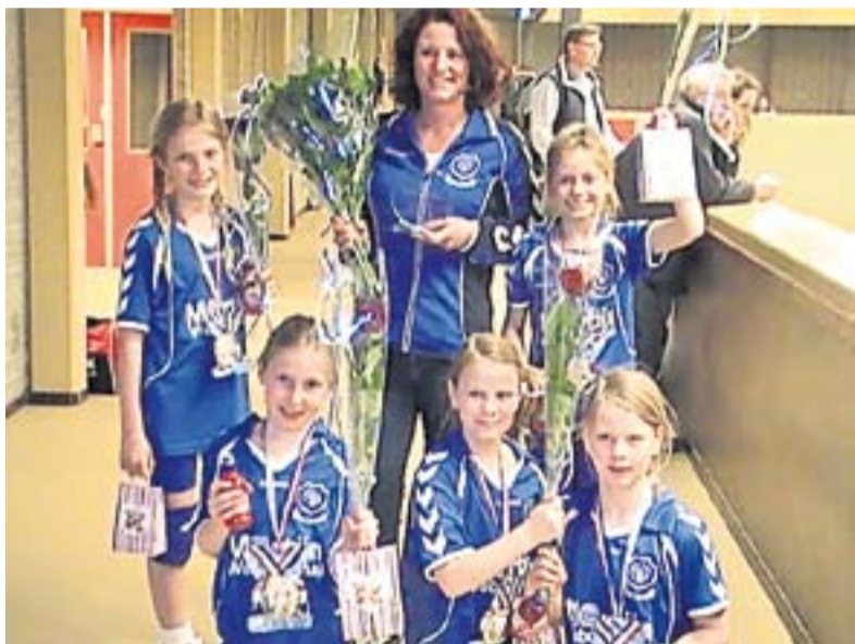
SCK volleybalteam N3-1 kampioen in de hoofdklasse A regio Apeldoorn en omgeving.

KLARENBEEK.- Nadat onlangs het jeugdteam N5-1 van de afdeling Volleybal van Sportclub Klarenbeek (SCK) kampioen was geworden, is ook het jeugdteam N3-1 (8/9 jaar) van kampioen geworden in de hoofdklasse A regio Apeldoorn en omgeving. Dit gebeurde in sporthal Theothorne in Dieren. Klarenbeek N3-1 werd kampioen met 47 punten uit vijftien wedstrijden. Dit resultaat