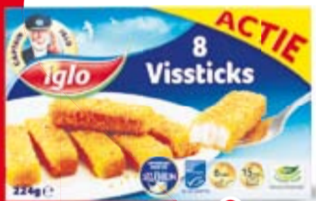
Iglo vissticks uit het vriesvak pak 8 stuks OP=OP