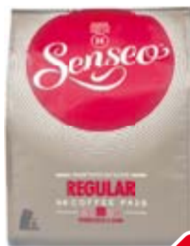
Douwe Egberts koffie alle varianten m.u.v. gemalen koffie pak, pot of zak