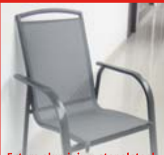
Futura aluminium stapelstoel normaal per stuk € 79,95