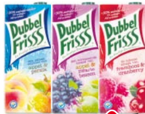
Dubbel Friss fruitdrink alle varianten 3 pakken à 1,5 liter Alle combinaties mogelijk