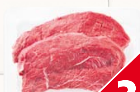
C1000 Magere runderlappen 500 gram