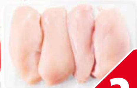
C1000 Kipfilet 500 gram