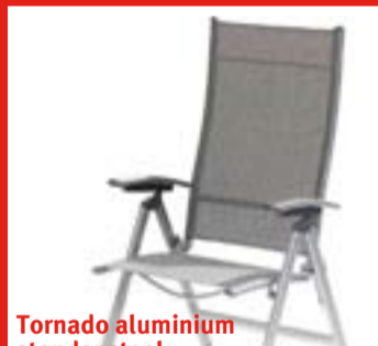
Tornado aluminium standenstoel normaal per stuk € 119,-