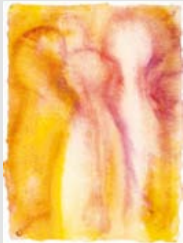
Roeli Willekes, Invocabit (In deze aquarel zie ik een beeld van mensen die verwarmd door Gods Geest ook zelf licht en warmte gaan verspreiden.)

Zoals Marijke de Bruijne dichtte (Tussentijds 178): dat de Geest van God ons een onrust meedeelt die soms als storm durft op te staan./ geweld en kwaad durft