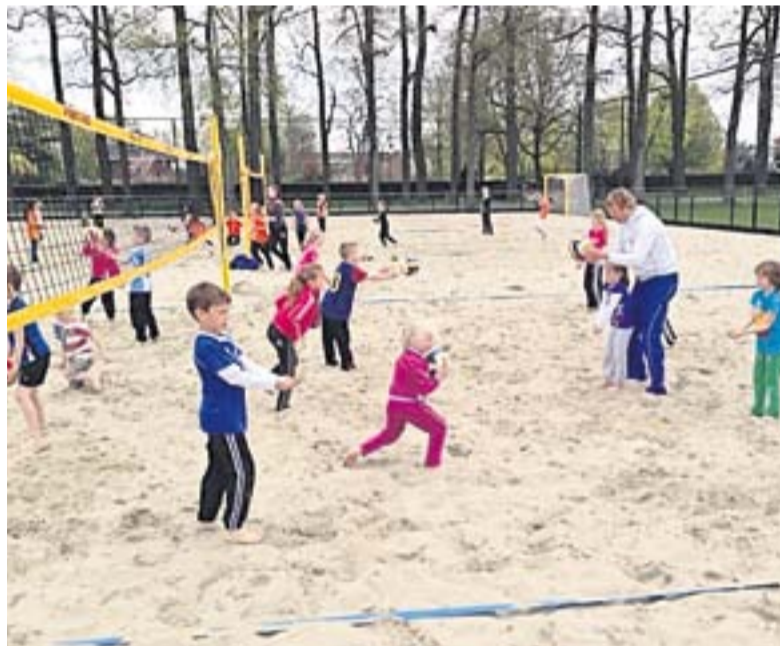
Volop actie tijdens de clinic.

TWELLO.- Vorige week donderdag werd er voor de 2e keer een clinic georganiseerd door Stichting Koepel sport, welzijn & cultuur en zwembad de Schaek in de schoolvakantie. De clinics zijn bedoeld om alle basisschoolleug van 6 t/m 13 jaar meer te laten sporten & bewegen en kennis te laten maken met verschillende sporten en verenigingen binnen de gemeente Voorst.