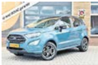
FORD ECOSPORT 2020 | Benzine €19.850,-