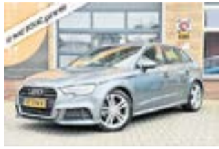
AUDI A3 2018 | Benzine €21.400,-