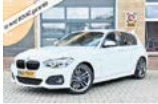
BMW 1-SERIE 2017 | Benzine €18.850,-