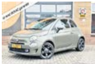
FIAT 500 2019 | Benzine €14.650,-