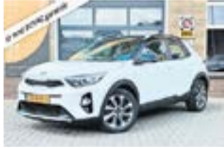
KIA STONIC 2019 | Benzine €15.850,-