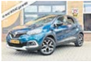
RENAULT CAPTUR 2019 | Benzine €13.700,-